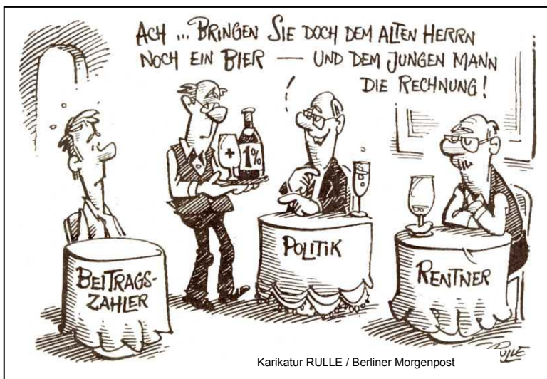
Karikatur RULLE / Berliner Morgenpost

Deshalb wendet sich die Fraktion DIE LINKE . im Bundestag entschieden gegen die Anhebung des gesetzlichen Renteneintrittsalters. Sie fordert stattdessen eine sozial gerechte Rentenreform. Sozialverbände und Gewerkschaften sowie viele andere gesellschaftliche Kräfte sind sich mit der Fraktion DIE LINKE . einig, dass es Alternativen zur gegenwärtigen Rentenpolitik der Großen Koalition gibt.